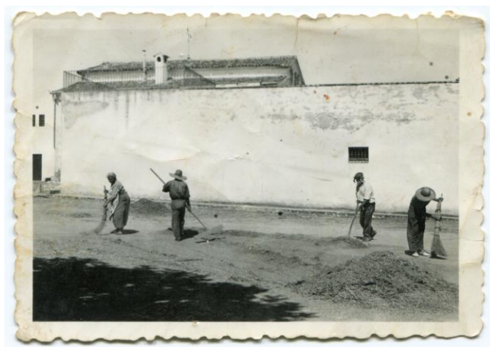
Figura 8. L'era de la Torre, batent llegums, els anys quaranta.

Les dones també feien feines a la vinya com esporgar, escavallar, collir raïms, anar a buscar herba pels conills, recollir els fruits, batre els cereals i els llegums a l'era... Les condicions d'algunes d'aquestes feines estan descrites en la primera clàusula del contracte signat. El propietari cedeix a l'arrendatari tota la palla i residus resultants de la batuda dels grans d'espiga i llegums, excepte els anomenats "espigams" (trossos d'espiga mal batuda que no passen pel garbell) que s'apartaran tots els dies per incorporar-se a la batuda del dia següent i amb l'expressa prohibició de vendre la palla abans del primer d'abril. Per aquestes feines el propietari pagarà els jornals d'un home durant el període de batuda. En un altre apartat del contracte, s'especifica que l'arrendatari no podrà portar a l'era de la Torre els seus fruits abans d'haver fet totes les operacions de la batuda de les gavelles de grans d'espiga i de llegums del propietari. En la fotografia hi veiem com es feia aquesta feina i la primera de l'esquerra és una dona.