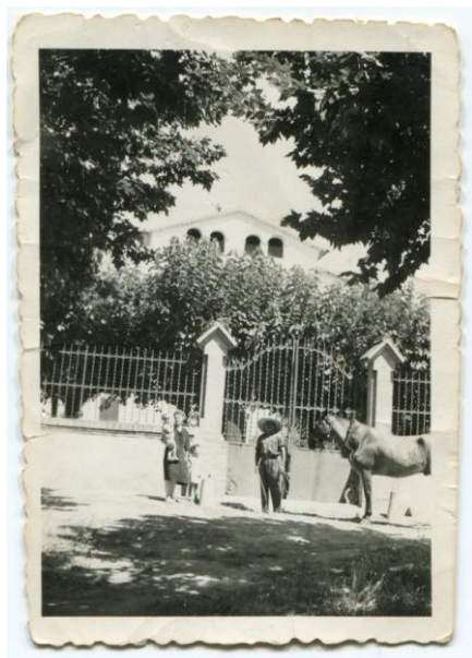
Figura 9. Entrada principal de la casa de la Torre, anys 40.

L'inici és el mateix que el contacte de lloguer de la masoveria i diu que Pedro Rius y Matas concedeix en arrendament a José Pascual y Via unes peces de terra senyalades amb els números 7,19, 47, 48 i 49 procedents de l'heretat denominada La Torre. Aquestes peces eren camps o files de ceps, excepte la número 47, anomenada "Vinya La Plana", que era plantada de "vinya espessa". En total 10,5 "jornals del país, 27 " situats a l'entorn de la masia de la Torre. Aquestes peces de terra s'hauran de dedicar als cultius esmentats i l'arrendatari no podrà canviar-los sense permís escrit de l'amo. Tampoc s'hi podran plantar més arbres dels que hi han. Respecte als danys que puguin provocar les aigües torrencials o altres agents atmosfèrics l'arrendatari es veurà obligat a reparar-los, fent totes les rasses que siguin necessàries.