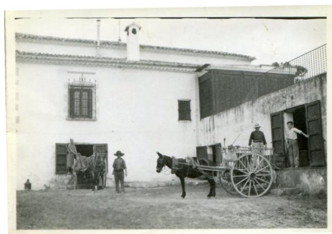
Figura 5. Els cellers de la Torre, el mes de setembre de 1944.

En el segon full del contracte hi ha, escrites a màquina, les condicions. Una de les primeres diu que en el lloguer de la casa s'inclou "los lagares" (cups), la premsa i el celler que es troben a la planta baixa de la casa del propietari. A la fotografia 24 es veu el celler dels masovers (en front) i a la dreta el celler de l'amo.