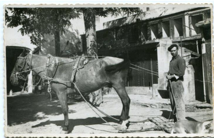
Figura 6. Pati i entrada de la masoveria de la Torre, a l'any 1943.

En el contracte s'inclouen el paller i totes les estances i dependències per a la cria de porcs, conills, cabres i aus de corral que en aquell moment existien en el pati de la casa dels masovers i també l'hort anomenat "de la basa", a continuació del pou i l'espai de rentar de nova construcció. Una part d'aquestes dependències es poden veure a la fotografia, on hi apareix el Jepet amb el cavall, com recorda la Victòria Pascual: el "Romero".