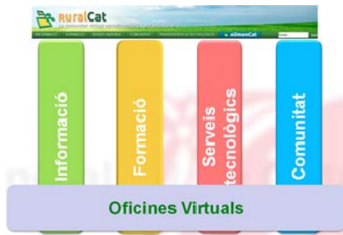
Figura 1. Els pilars de RuralCat

Després de valorar el funcionament de les of icines virtuals, es va posar de manifest que hi ha molts professionals, vinculats als àmbits als quals dóna servei el portal, que per les seves característiques més a ccessòries no estan ni representats ni poden ser usuaris d'aquests espais temàtics que són les oficines virtuals, malgrat