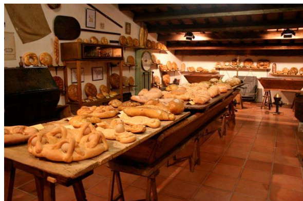
El Museu del Pa de Tona