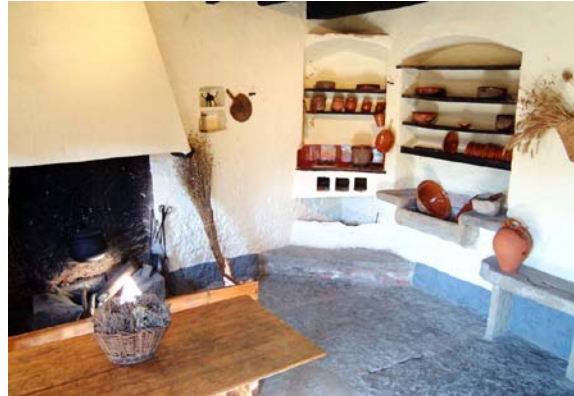
La Casa Museu Verdaguer de Folgueroles amb la seva cuina