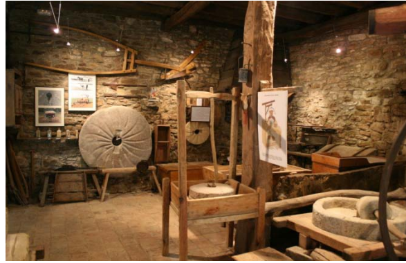
La bassa i l'obrador del Molí de la Calvaria de Calldetenes

Els diversos estaments que promouen el projecte treballen amb la certesa que un equipament patrimonial d'aquestes característiques posarà en valor la comarca com un territori que històricament ha tingut un paper notable en el sector agroalimentari de Catalunya i que es preocupa per a la gestió futura d'aquest important patrimoni cultural. És en aquest context sociocultural on l'Ecomuseu del Blat permetrà donar elements per a constituir un referent identitari per a la població de la comarca i un element d'atracció del turisme cultural. L'Ecomuseu del Blat neix amb la voluntat d'aglutinar els diversos agents del món agrari, tant des del punt de vista memorialístic com industrial, amb la finalitat de conservar, estudiar i promoure la tradició agropecuària de la comarca d'Osona i posar-la en relació amb el món.