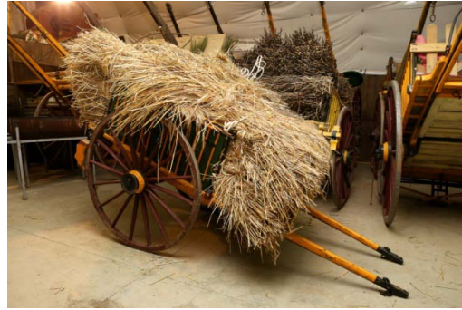
La Cabanya de la Roca i carros de l'Alzinar de la Roca de Taradell