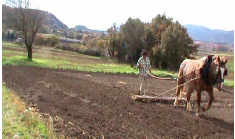
Parcel·lació del camp experimental dels Ametllers al mas El Colomer de Taradell. A la dreta, feina de rasclar el cereal sembrat amb tracció animal

Oferim un camp experimental on les diverses ciències conflueixin per donar l'oportunitat a les noves generacions de veure de prop, practicar i provar d'aprendre les tècniques a fi de realitzar les feines de cada fase del conreu. El procés queda documentat en imatges, vídeos i registres sonors que permeten revisar el procés anual de conreu i difondre'n les seves particularitats. La restitució del primer any del trènit ha permès contrastar el treball experimental amb les informacions orals i els documents. Aquest projecte, que va acabar la seva primera fase l'any 2013, ens permetrà verificar la pràctica del model agrícola descrit i fer noves aportacions en l'estudi de l'agricultura de la Plana de Vic al segle XX. En definitiva, oferir una nova via en el procés de recuperació de la memòria etnogràfica de les generacions de pagesos de la Plana de Vic, aportant nous elements per a la gestió dels paisatges humans i socials.