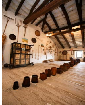
El mas El Colomer de Taradell i sala del blat